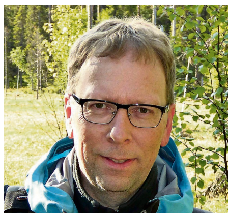
FOTOGRAFEN: Odd Pedersen fra Kongsberg har laget denne reportasjen.

Tom og Baard skulle være våre veiledere og turguider her dypt inne i de finske skoger, bare et par kilometer fra den Russiske grensen.