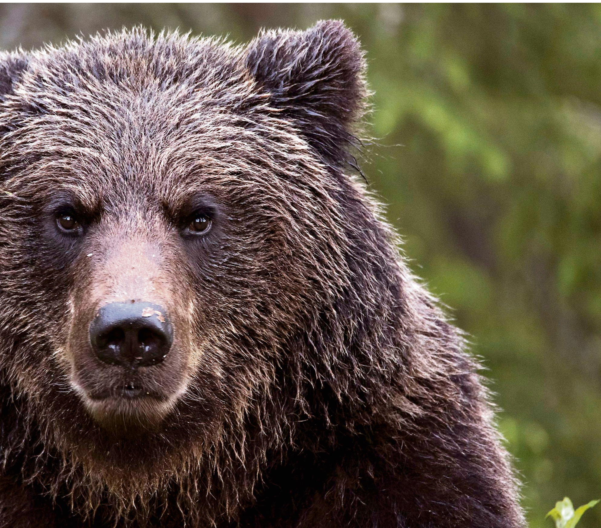
SJEFEN: Det var tydelig en hannbjørn som var sjef i dette området. Møtet med ham ble et spennende høydepunkt.